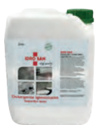
CDR.2020-5 Idro San 5Kg