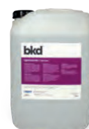
ZX.2350-10 BKD®-Purple 10L