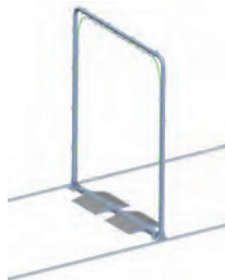
Particolare dell'arco disinfezione