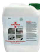
CDR.2020-5 Idro San 5Kg